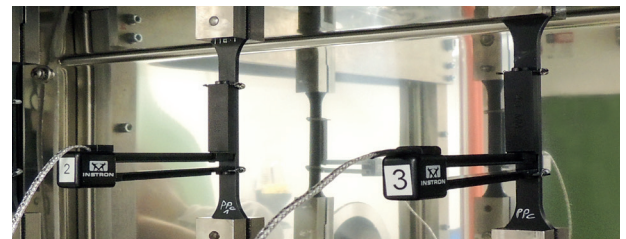
1 Zugproben mit Wegmesssystem.

mit hoher Genauigkeit abbilden. Darüber hinaus werden am Fraunhofer IWM auch mikromechanische Kriechmodelle entwickelt, mit denen der Einfluss der Mikrostruktur vorhergesagt werden kann – das Insert in der Abbildung 2 zeigt ein Beispiel. Dies ermöglicht eine zielgerichtete Werkstoffoptimierung unter Berücksichtigung von Faser-, Matrix- und Grenzflächeneigenschaften sowie der Mikrostruktur (Faseranteil, -orientierung, -länge).